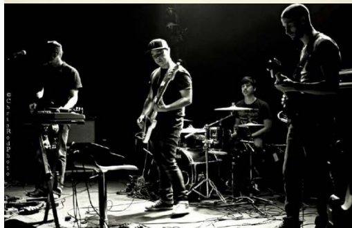
PEAR BLOSSOM HIGHWAY

Pearblossom Highway (PBH) est né à Toulouse en juin 2012, de la rencontre de 4 musiciens partageant la même envie d'explorer les méandres de la musique psyché. Début 2013, PBH travaille avec Christophe Calastreng et enregistre son premier album, un quatre titres qui posera les bases de l'univers du groupe, un Rock réverbéré et puissant plongeant profondément ses racines dans les sons d'outre Atlantique.